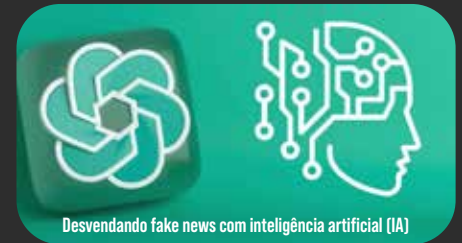
Desvendando fake news com inteligência artificial (IA)

Explorando como a IA Chat GPT pode ser utilizada para combater a desinformação e identificar notícias falsas.