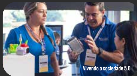
Vivendo a sociedade 5.0