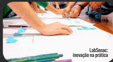
LabSenac: inovação na prática

Educar é como construir uma história. Inovar não precisa ser uma coisa mirabolante e espetacular. Processos inovadores são necessidades superadas que surgem dos envolvidos no processo educativo. Vamos mexer com essa tal “inovação”?