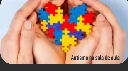
Autismo na sala de aula