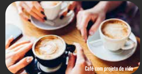
Café com projeto de vida

Utilizando o café como conexão vamos refletir sobre o cotidiano escolar e o incentivo aos adolescentes do Ensino Médio a construir o seu projeto de vida.