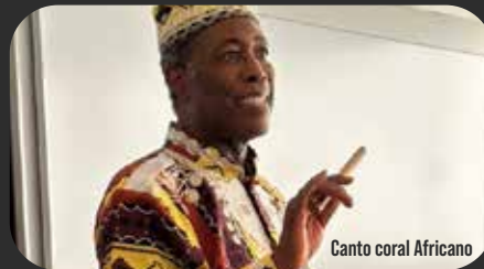
Canto coral Africano